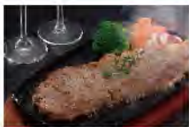
信州プレミアム牛肉 サーロインステーキ