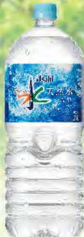
アサヒ おいしい水 天然水 六甲 PET2L