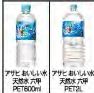
アサヒ おいしい水 天然水 六甲 PET600ml